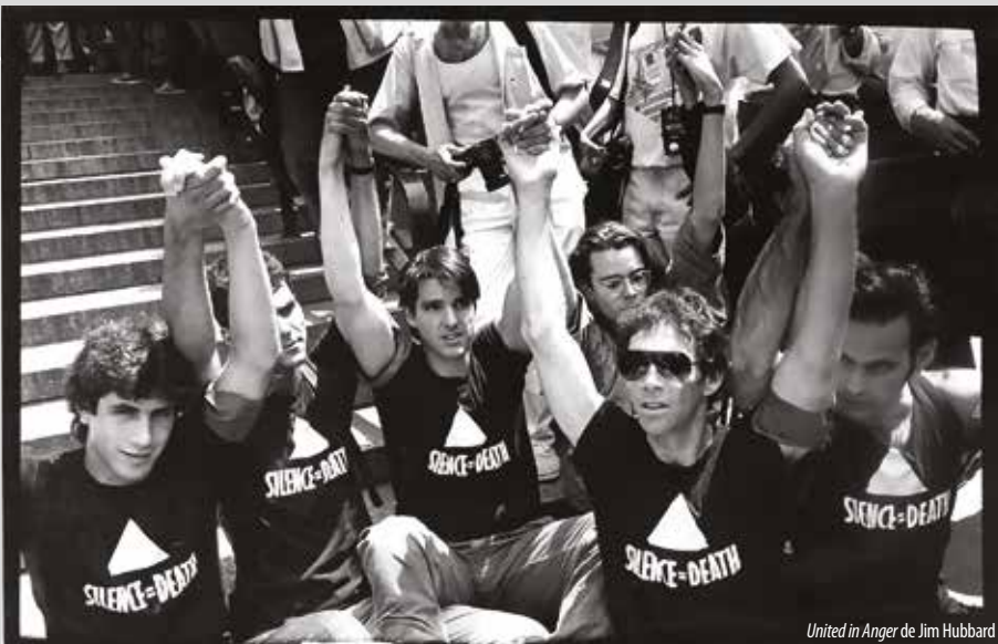
United in Anger de Jim Hubbard