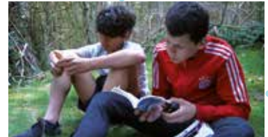
Loin de vous j'ai grandi